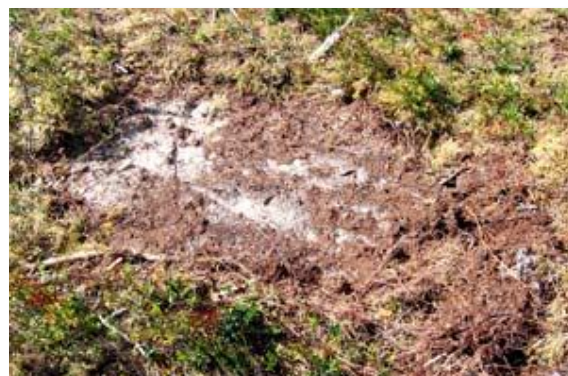
Markberedning for naturlig foryngelse gjøres grunnere enn for planting.

Ved å justere vinkel og marktrykk på furemarkbereder gir den et godt resultat. Gravemaskin er også egnet når man er «lett på labben».