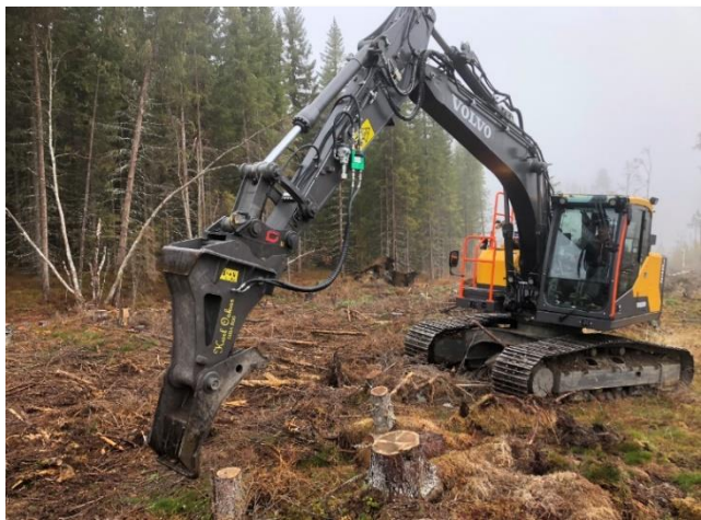
Gravemaskin med Karl Oscar aggregat