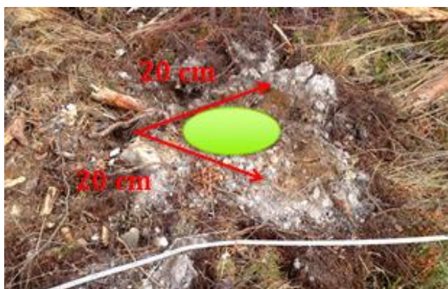
Godkjent planteplass med mineraljord på toppen.

Mineraljordshaugen skal være maksimalt 10 cm tjukk.