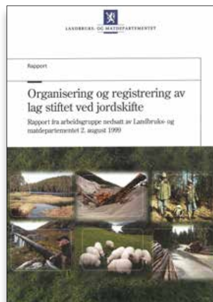
Figur 4 Rapport fra Landbruks- og matdepartementet