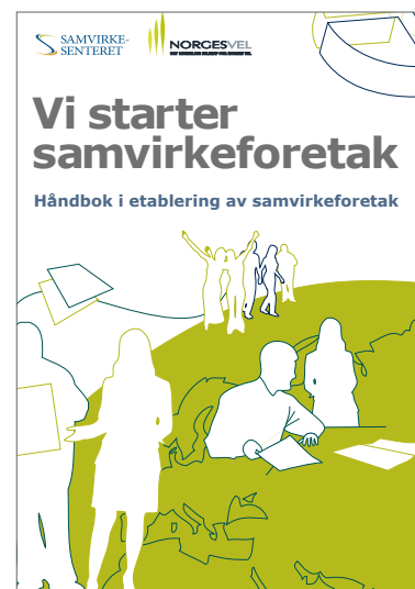
Figur 3 Håndbok i etablering av samvirkeforetak.

Et samvirkeforetak skal ha vedtekter, jf. lovens §§ 9 og 10. Foretaket skal ha et styre med minst 3 medlemmer, dersom ikke vedtektene sier at det skal være 2, jf. § 64. Har styret 2 medlemmer, skal det velges minst ett varamedlem, jf. § 66.