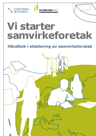
Figur 3 Håndbok i etablering av samvirkeforetak.

I et samvirkeforetak har «kvar medlem ei røyst på årsmøtet», men det er etter lovens § 38 tillatt med gradert stemmegivning (må framgå av vedtektene), jf. også veglovens § 55.